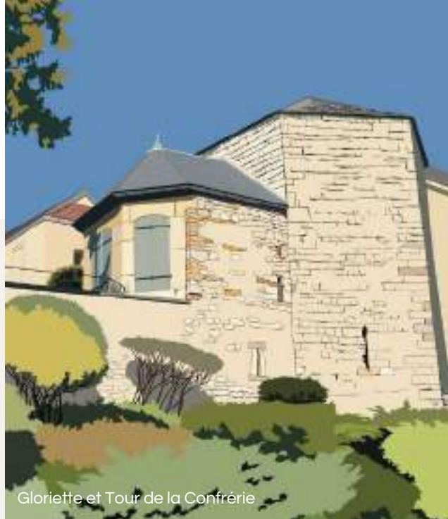
Gloriette et Tour de la Confrérie

Sa nombreuse descendance (Robert II, Hugues V, Eudes IV, Philippe de Rouvres) connaîtra une histoire riche et mouvementée, agrémentée de visites, et